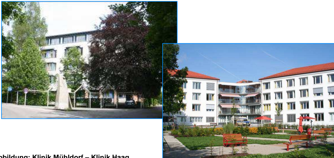
Abbildung: Klinik Mühldorf – Klinik Haag

Eine wesentliche Rahmenbedingung bei der Erfüllung dieses Auftrags wird in den §§135ff SGB V vorgegeben. Danach sind „(...) zugelassene Krankenhäuser (...) verpflichtet, sich an einrichtungsübergreifenden Maßnahmen der Qualitätssicherung zu beteiligen (...)“ und „einrichtungintern ein Qualitätsmanagement einzuführen und weiterzuentwickeln“.